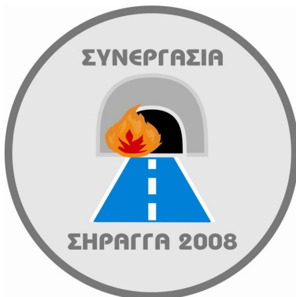
Σχήμα 1: Λογότυπο –Συμβολισμός